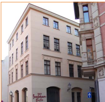
Halle - Kuhgasse

Nach vorläufigen Berechnungen des statistischen Bundesamtes betrug das Wirtschaftswachstum in Deutschland preisbereinigt 2,5 Prozent. Die Verbraucherpreise erreichten mit einer Steigerung von 2,2 Prozent ebenfalls den stärksten Anstieg seit 1994. Haupttreiber dieser Entwicklung waren die stark gestiegen Preise für Energie (Öl, Gas) und Lebensmittel. Nicht zuletzt aufgrund des steigenden Preisniveaus und der Finanzmarkturbulenzen wird nun von einer leichten Abschwächung des Wirtschaftswachstums ausgegangen. Dieses soll nach Aussage des Instituts für Wirtschaftsforschung Halle (IWH) im Jahr 2008 1,7 Prozent und im darauffolgenden Jahr 2,0 Prozent betragen.