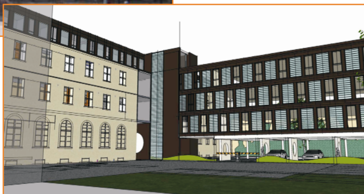
Objektoptimierung des historischen Postgebäudes in Weimar zum Fachärzteezentrum