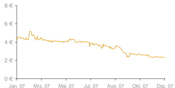
Kursverlauf der informica real invest AG im Jahr 2007 (Xetra)

28. Dezember 2007 schloss der DIMAX bei 585,04 Punkten, knapp 31 Prozent unter dem Vorjahresvergleichswert.