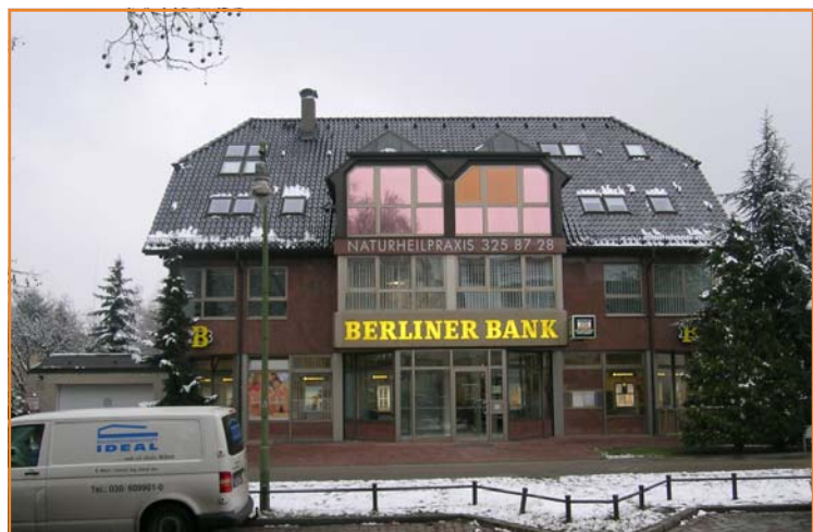
Berlin Alt Rudow

Die durch die Subprime-Krise verursachte zögerliche Kreditvergabe trifft vorwiegend Unternehmen, die mit sehr hohen Fremdkapitalquoten (Private Equity/Hedge Fonds) einzelne Investitionsobjekte finanzieren. Schwerpunktmäßig ist der Bereich von gewerblichen Immobilieninvestments sowie Portfoliotransaktionen betroffen. Es ist daher zu beobachten, dass diese Käufergruppen nicht mehr am Immobilienmarkt auftreten und, wie in der Vergangenheit oftmals geschehen, dort die Preise anheizen. Als Konsequenz sind in vielen dieser Bereiche rückläufige Preisniveaus und steigende Netto-Anfangsrenditen zu verzeichnen.