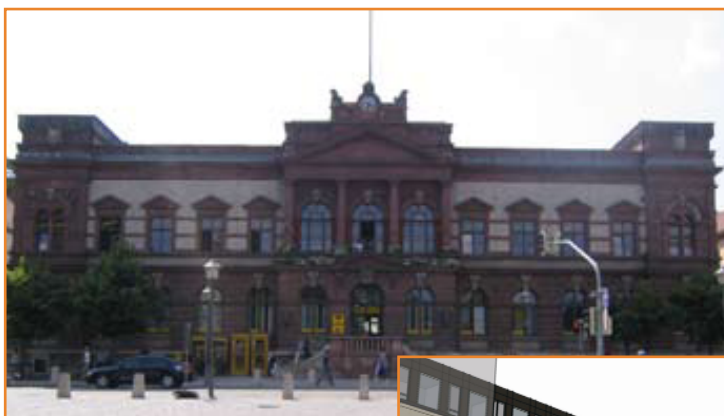
Historisches Postgebäude in Weimar

Nach wie vor wird sich die informica real invest AG beim Bestandsaufbau des Immobilienportfolios auf den selektiven Ankauf von hochrentablen Wohn- und Geschäftshäusern aus innerstädtischen und gut vermarktbarsten Lagen konzentrieren. Sämtliche erworbene Objekte befinden sich in einem guten Zustand, verfügen über einen hohen Vermietungsstand (aktuell zu 97 Prozent vermietet) und weisen ein gewisses Entwicklungspotenzial bei den Mieteinnahmen auf. Aufgrund der lukrativen Immobilien werden hohe Eigenkapitalrenditen und nachhaltig hohe Cashflows durch Mieteinnahmen (aktuell 8,64 Prozent Mietrendite auf das investierte Kapital) generiert. Gleichzeitig wird die Gesellschaft wie in der jüngsten Vergangenheit bei Opportunitätsgeschäften aktiv sein. Hier sollen vor allem kurzfristige Zusatzrenditen liquiditätswirksam gehoben werden. Aufgrund der bei uns eingehenden Immobilienangebote sind wir nach wie vor zuversichtlich, das Immobilienportfolio zum Geschäftsjahresende 2008/2009 auf bis zu EUR 160 Millionen auszubauen. Das Erreichen dieser Kennzahl wird dabei auch durch die Stimmung an den Kapitalmärkten determiniert sein.