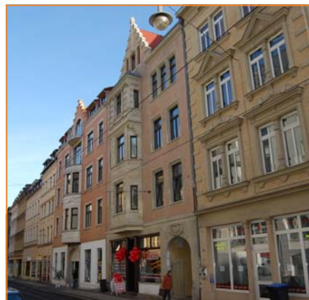
Halle - Geiststr. / Harz

Die Wohn- und Gewerbeimmobilienmärkte hielten sich in Jahr 2007 stark. Die Subprimekrise wirkte sich auf den deutschen Immobilienmarkt nur indirekt aus.